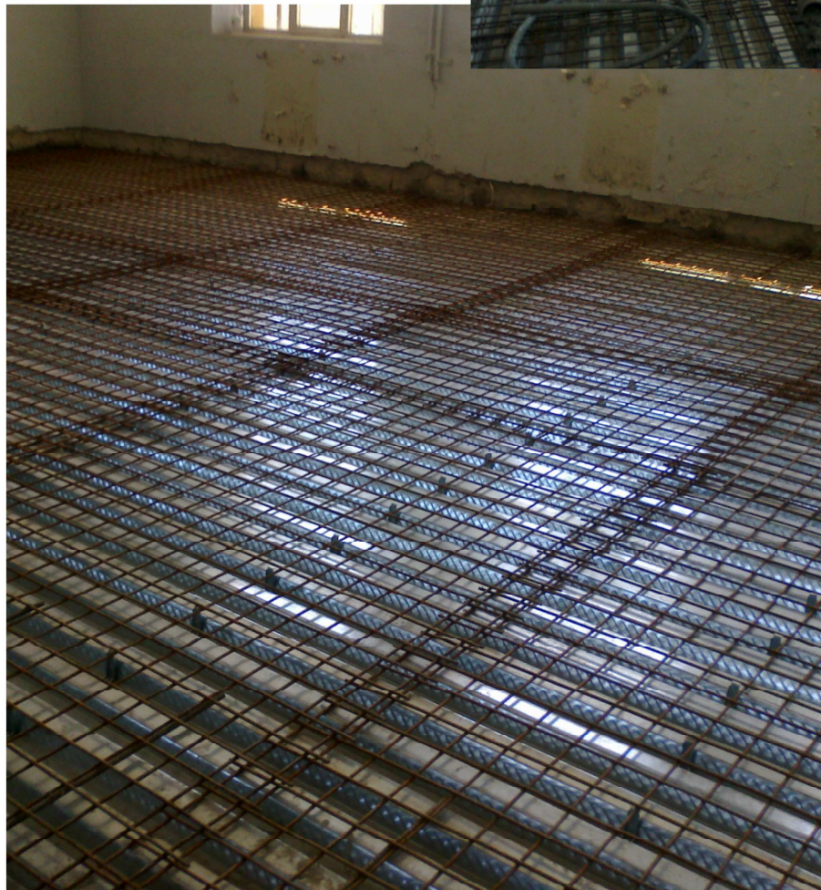
il getto della soletta